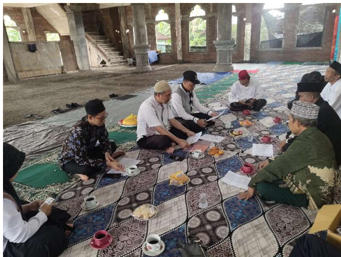
Gambar 3 : Sosialisasi tentang pentingnya sertifikasi dan pendataan tanah wakaf di Masjid Nurul Hayat, Kec. Bebandem, Kab. Karangasem