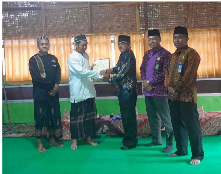
Gambar 1: Penyerahan 3 Sertifikat Tanah Wakaf oleh Kepala Kan Kemenag Di Madin Al Husan Br. Dinas Kecicang Islam

Adapun dokumentasi dari kegiatan tersebut di atas adalah sebagai berikut: