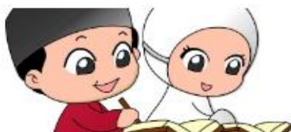
PENGAJUAN TANDA DAFTAR TAMAN PENDIDIKAN QU'RAN (TPQ)