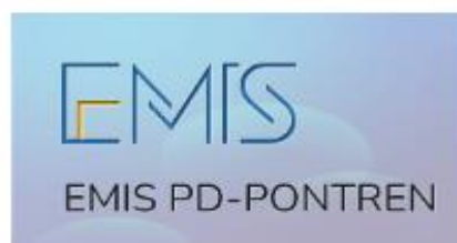
PENDATAAN EMIS PD-PONTREN