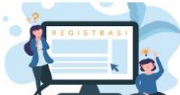
PENGAJUAN TANDA DAFTAR MADRASAH

Sistem Layanan Raudhatul Athfal dan Madrasah