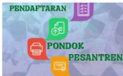
PENGAJUAN TANDA DAFTAR PESANTREN