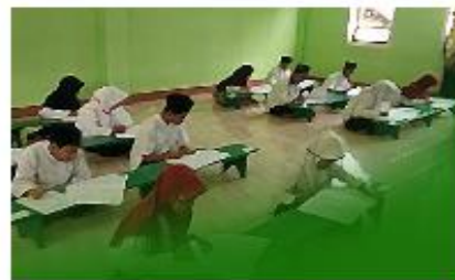
PENGAJUAN TANDA DAFTAR MADRASAH DINIYAH (MADIN)