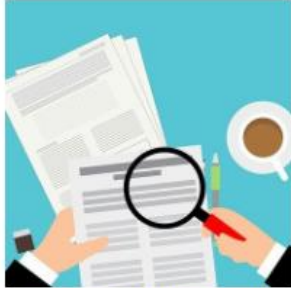
REVISI ANGGARAN MADRASAH MERGER