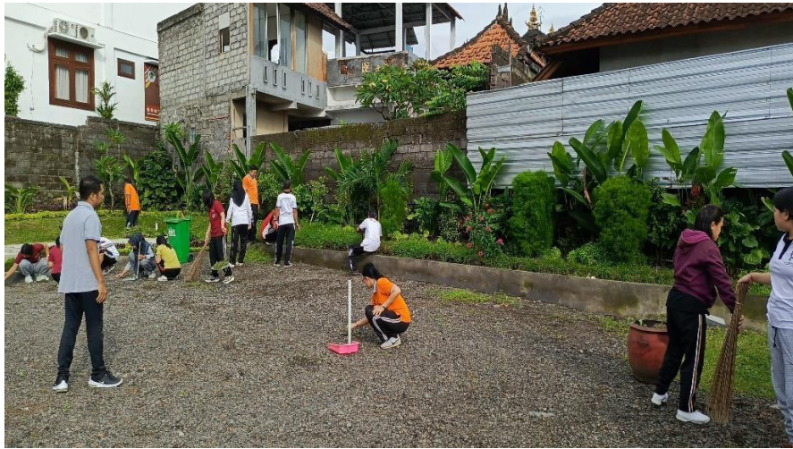
Gambar Kegiatan GIZI dan Bersih-bersih Lingkungan