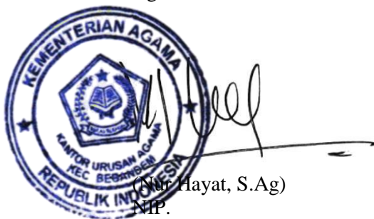
(M. Hayat, S.Ag) NIP.