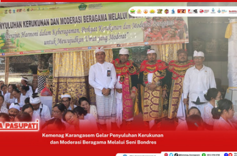
Kemenag Karangasem Gelar Penyuluhan Kerukunan dan Moderasi Beragama Melalui Seni Bondres