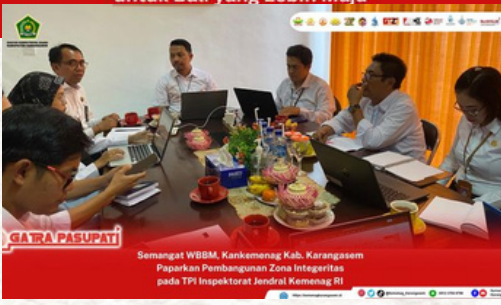
Semangat WBDM, Kankemenag Kab. Karangasem Paparkan Pembangunan Zona Integritas pada TPI Inspektorat Jendral Kemenag RI