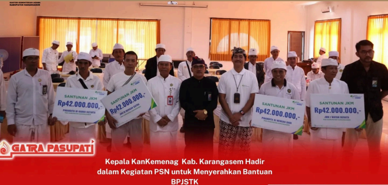
Kepala KanKemenag Kab. Karangasem Hadir dalam Kegiatan PSN untuk Menyerahkan Bantuan BPJSTK