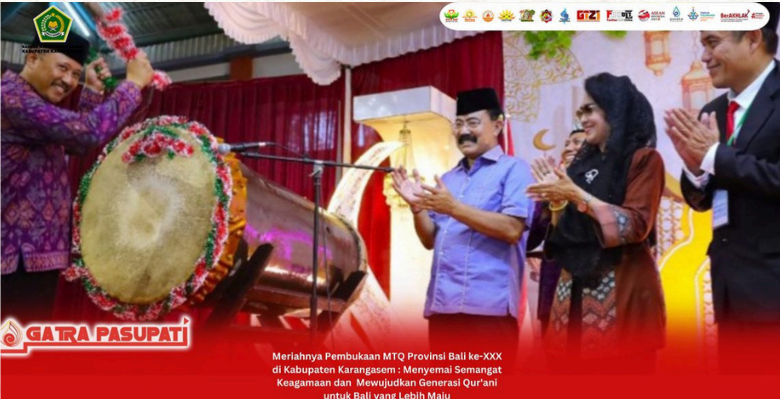
Meriahnya Pembukaan MTQ Provinsi Bali ke-XXX di Kabupaten Karangasem : Menyemai Semangat Keagamaan dan Mewujudkan Generasi Qur'ani untuk Bali yang Lebih Maju